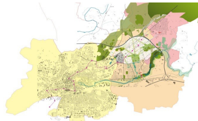
Situation de ViaSilva dans l'agglomération

Prescriptions programmatiques et de conception durable en réponse aux critères de désirabilité du logement aux différentes échelles de projet (conception interne, unité résidentielle et interface avec la ville.